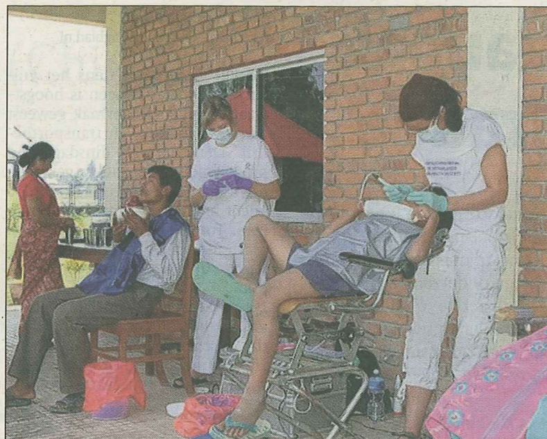
Bij de Kumarischool in het afgelegen Nepalese dorpje Kawasoti behandelen tandartsen en assistenten op eenvoudige wijze de inlandse bevolking.