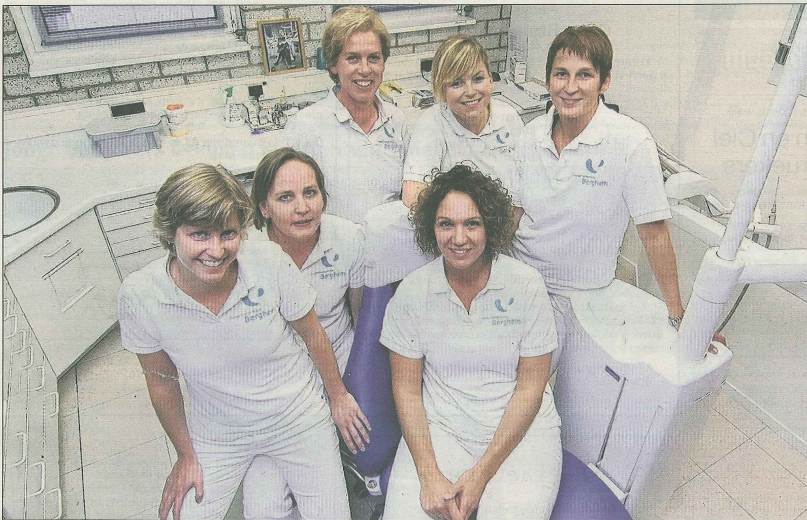
De zes vrouwen van de Berghemse tandartsenpraktijk die eind deze maand gedurende drieëneenhalve week tijdens een zogeheten 'dental camp' Nepalese inlanders gaan helpen: „Ons werk zal vooral bestaan uit kiezen trekken en voorlichting geven.”